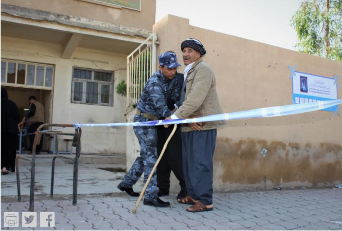
كركوك/ أيار 2018/ تفتيش الناخبين أمام مركز انتخابي خلال انتخابات البرلمان العراقي