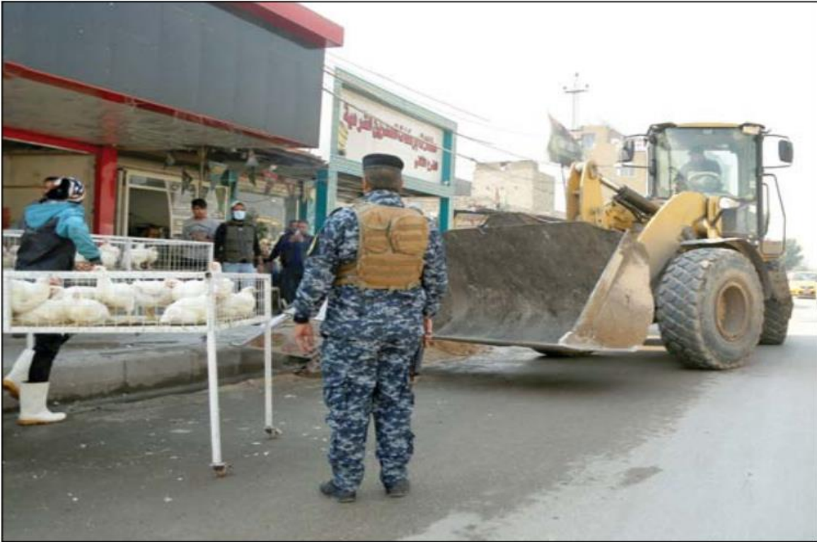
لجنة الخدمات النيابية تحذر من إزالة التجاوزات بلا حلول للفقراء ... عدسة: محمود رؤوف