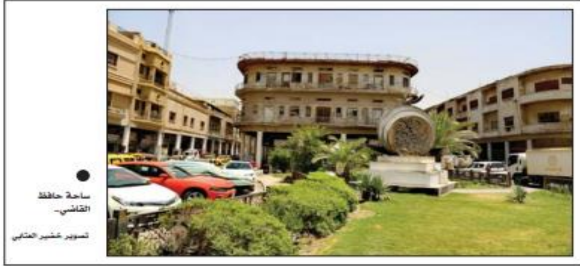
● ساحة حافظ القاسي